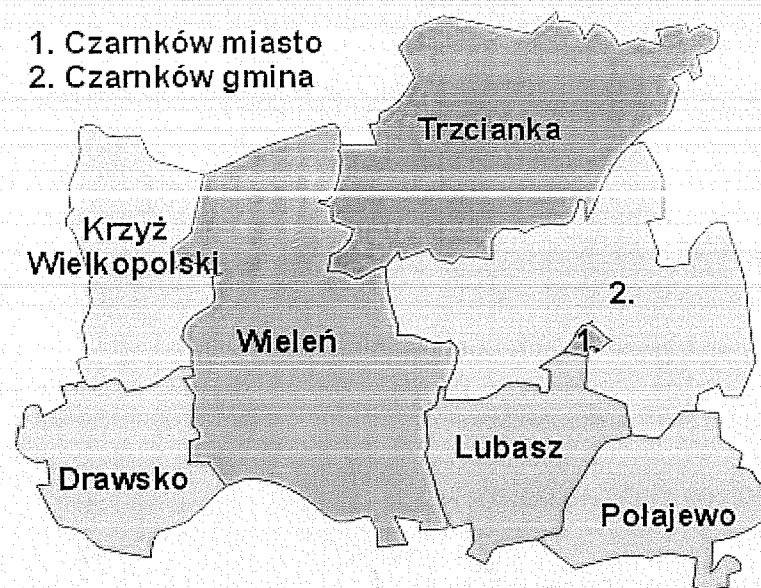
Rysunek 1. Gmina Lubasz na tle czarnkowsko – trzcianeckim

Odległość od stolicy województwa – Poznania - wynosi około 70 km, a stolicy powiatu – Czarnkowa – 10 km.